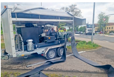
Praxistest an der Tauber.