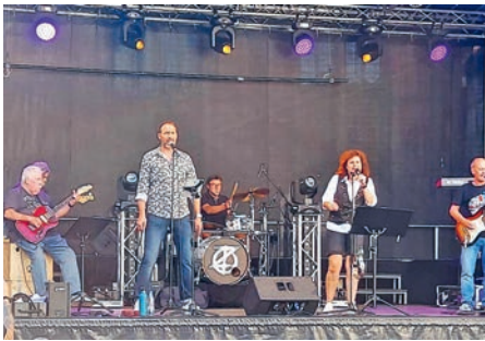
After Eight Band