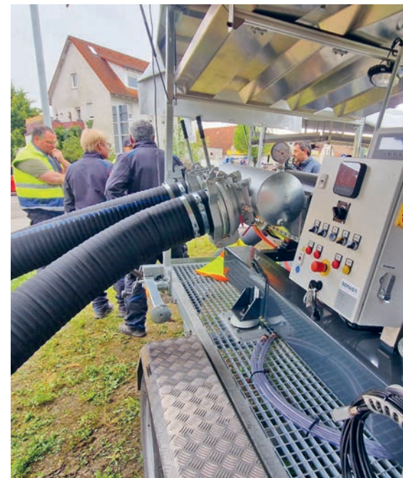
Teamarbeit und Augenmaß brachten die Geräte sicher auf's Gelände der Kläranlage.

Die beiden neuen Pumpaggregate der Firma Börger befinden sich auf einem Pkw-Anhänger und haben jeweils eine Pumpleistung von maximal 250 Liter pro Sekunde. Ähnliche Pumpen werden auch vom THW in Hochwassergebieten eingesetzt. Mit Zustimmung des Gemeinderates wurden hier knapp über 186.000 Euro investiert.