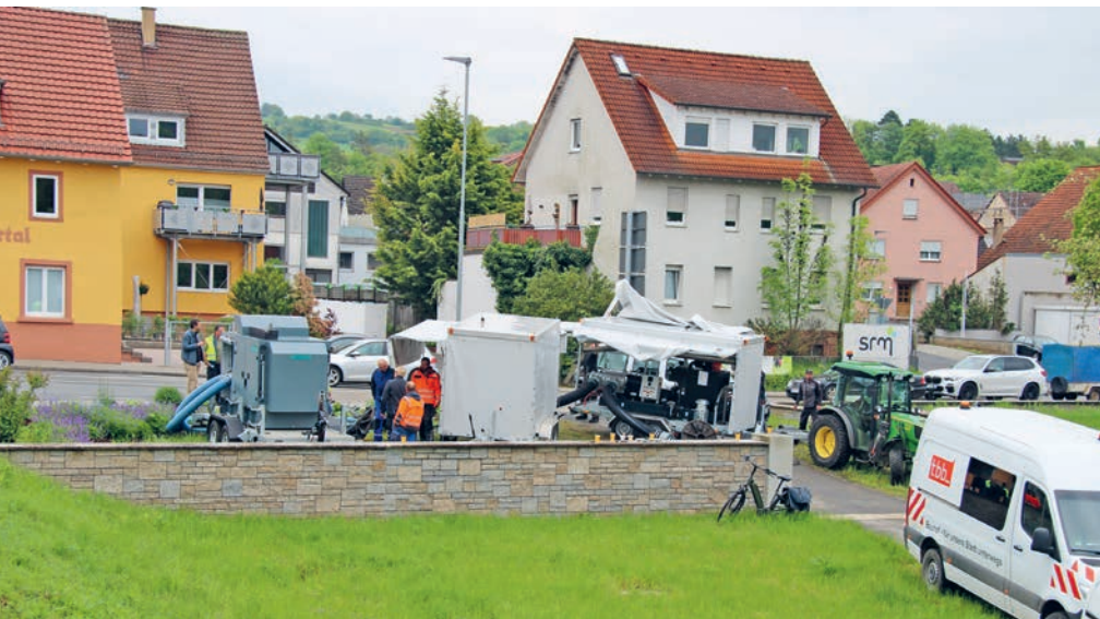
Viel Manpower und Equipment war vor Ort, um den Einsatz zu proben und Abläufe zu optimieren.