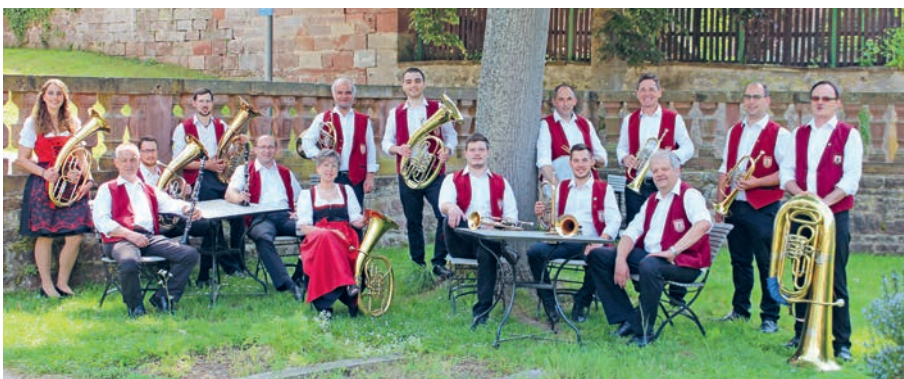
Die Musikkapelle Dienstadt spielt auf dem Marktplatz von 10.30 bis 12 Uhr.