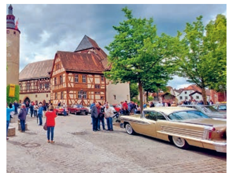
Oldtimertreffen auf dem Schlossplatz von 8.30 bis 16 Uhr.

Ein Besuch in der Innenstadt lohnt am Samstag, 3. Juni , besonders. Auf dem Schlossplatz werden ab 8.30 Uhr um die 100 Oldtimer-Autos und -Motorräder erwartet. Bis 16 Uhr können die Schätzchen bestaunt werden, die der Automobilclub Tauberbischofsheim e. V. eingeladen hat.