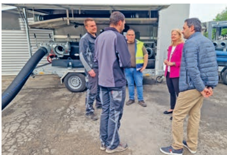
Eine enge Abstimmung aller Beteiligten ist wichtig.