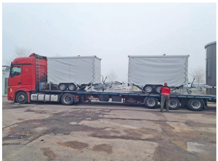
Im April angekommen: Zwei Hochleistungspumpen auf Anhänger