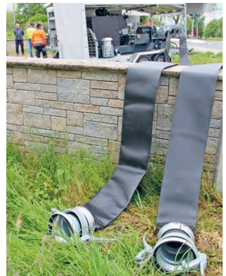
Mit volle Kraft geht es über die Hochwasserschutzmauer.

Die Stadt Tauberbischofsheim hat im April zwei neue mobile Hochleistungswasserpumpen bekommen. Sie sollen im Hochwasserfall mit gleichzeitigem Starkregen den Bereich Stadteingang bis Tauberbrücke schützen. Zusammen mit der seit 2020 vorhandenen kleineren Pumpe können nun 590 Liter pro Sekunde als Gesamtleistung erbracht werden. Die Teams vom städti-