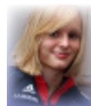
Artikel: Karina Mantai Degen

Ich denke, dass ich später mit Freude auf diese Zeit zurückblicken werde.