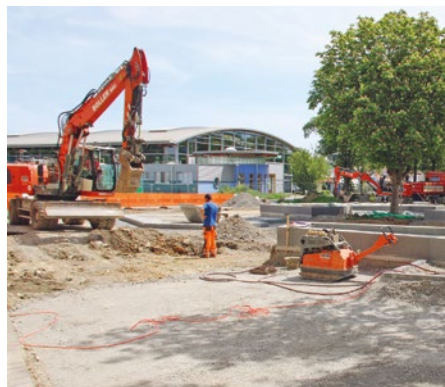
Am Pausenareal für das Schulzentrum am Wört wird noch gebaut.

„Mit einer kreativen, einladenden Gestaltung und sinnvoll geplanten Spielanlagen soll bei Kindern die Lust auf Bewegung geweckt werden. Es ist erwiesen, dass kognitive und körperliche Entwicklung gleichzeitig ablaufen und eng miteinander verknüpft sind. Eine sinnvolle, bewegungsfreundliche und kreative Schulhofgestaltung ist für die Entwicklung der Kinder enorm wichtig.“