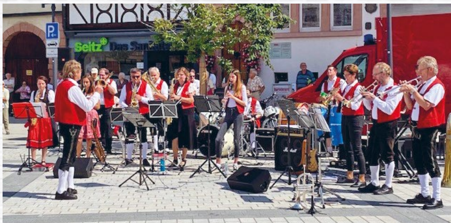
Stadt- und Feuerwehrkapelle Tauberbischofsheim

Am 18. Juni präsentieren sich bis zu 50 Oldies auf dem Marktplatz der Kreisstadt. Nach einer gemütlichen Ausfahrt ab Lauda erreichen die historischen Fahrzeuge über den Schlossplatz und die obere Fußgängerzone das Etappenziel. Musikalisch werden die außergewöhnlichen Modelle und ihre Lenker ab 10.30 Uhr durch die Stadt- und Feuerwehrkapelle unter der Leitung von Gustav