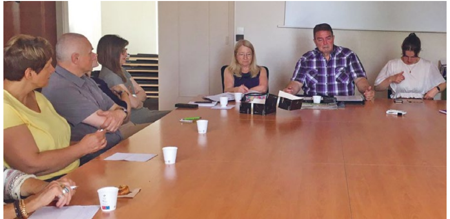
Konzentrierte Gesichter bei der gemeinsamen Arbeitssitzung im Rathaus.

Nach über zweijähriger pandemiebedingter Pause trafen sich die Partnerschaftskomitees der Städte Tauberbischofsheim und Vitry-le-François am Wochenende 20. bis 22. Mai zu einer gemeinsamen Arbeitssitzung. Zwar konnte man, nachdem es aufgrund von Terminüberschneidungen und Erkrankungen zu einigen Absagen kam, nur zu dritt nach Vitry reisen, doch tat dies der guten Atmosphäre beim langersehnten Wiedersehen keinen Abbruch. Die französischen Freunde hatten ein reichhaltiges Programm für ihre Gäste vorbereitet, und so kam keine Langeweile auf. Da auch das Wetter mitspielte, konnte man nach drei Tagen ein rundum zufriedenes Fazit ziehen.