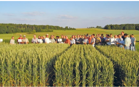
Versuchsfeldführung an Weizenparzellen auf dem Zentralen Versuchsfeld Boxberg-Schwabhausen: In diesem Jahr stehen im Juni wieder drei solche Rundgänge an.

Das Landwirtschaftsamt des Landratsamtes Main-Tauber-Kreis bietet zusammen mit dem Landwirtschaftsamt des Landratsamtes Neckar-Odenwald-Kreis an drei Terminen jeweils einen Feldrundgang am Zentralen Versuchsfeld in Boxberg-Schwabhausen an. Die Rundgänge finden am Donnerstag, 23. Juni, um 19 Uhr, am Freitag, 24. Juni, um 14 Uhr und am Dienstag, 28. Juni, um 19 Uhr statt.