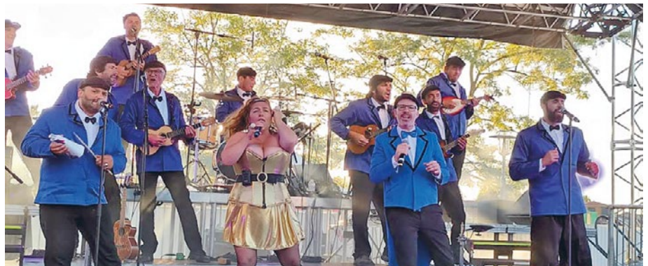
Sie brachten das Publikum zum Toben – das „Grand Ukulele Syndicate“, beim Konzert am See am Samstagabend

Einig waren sich die Protagonisten auf beiden Seiten, dass es enorm wichtig ist, endlich wieder in direkten persönlichen Kontakt treten zu können. Die erzwungene Lethargie während der Pandemiebeschränkungen soll rasch überwunden werden, und die Freundschaft und Partnerschaft der beiden Städte aus ihrem „Dornröschenschlaf“ geweckt werden. Psk