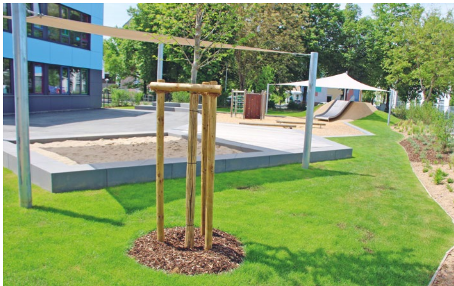
Das SBBZ-Pausenareal ist schon begrünt.

Das Außengelände am Schulzentrum am Wört nimmt Stück für Stück Gestalt an. Die Kinder vom SBBZ (Sonderpädagogisches Bildungs- und Beratungszentrum) können den Pausenhof nach den Pfingstferien bespielen. Die Park- und Fahrradstellplätze und viele Wege sind fast fertig. Im künftigen Pausenareal vom Schulzentrum am Wört und an der Zuwegung zum Wörtplatz wird noch fleißig gearbeitet. Insgesamt entstehen auf einer Fläche von 7.150 m 2 Grünanlagen, Wege, Stellplätze und Pausenareale.