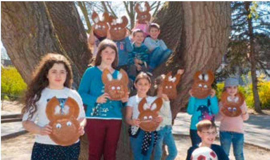
Bei der städtischen Osterferienbetreuung für Schulkinder bis einschließlich 5. Klasse stehen wieder viele Bastel- und Spielangebote passend zur Jahreszeit auf dem Programm.

Die Stadt Tauberbischofsheim bietet wieder eine Betreuung für Schulkinder bis zur 5. Klasse an. Das Angebot soll besonders berufstätige und alleinerziehende Eltern bei der Überbrückung der Ferienzeit unterstützen. Anmeldungen für die Osterferienbetreuung sind ab sofort im städtischen Familienbüro oder auch online unter www.tauberbischofsheim.feripro.de möglich. Die Osterferienbetreuung findet vom 26. März bis 6. April an der