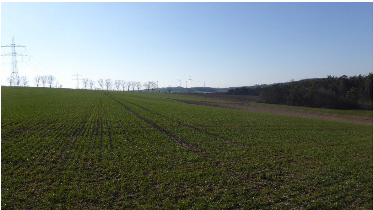
Abb.3: Blick von Osten auf das Baugrundstück (Blickrichtung nach Westen)