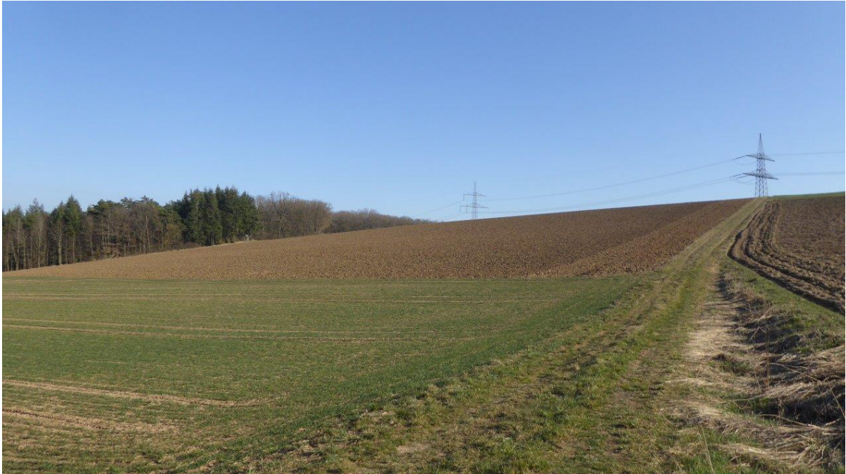
Abb.2: Blick von Norden nach Südosten auf das Baugrundstück