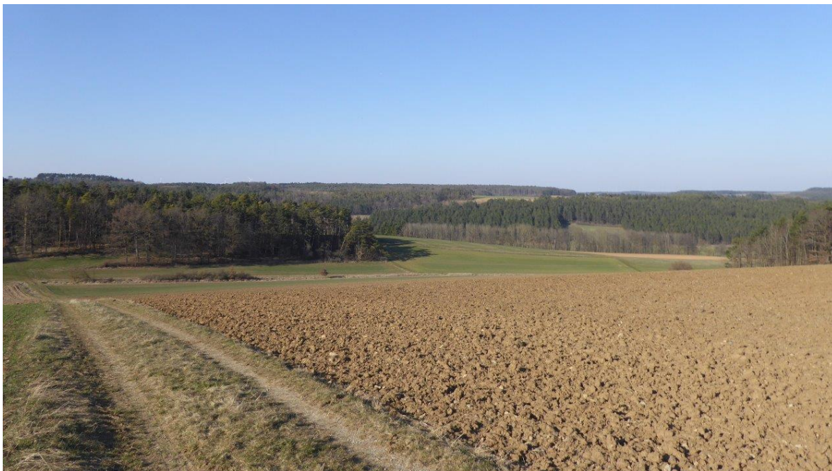
Abb.4: Blick von Süden nach Nordosten