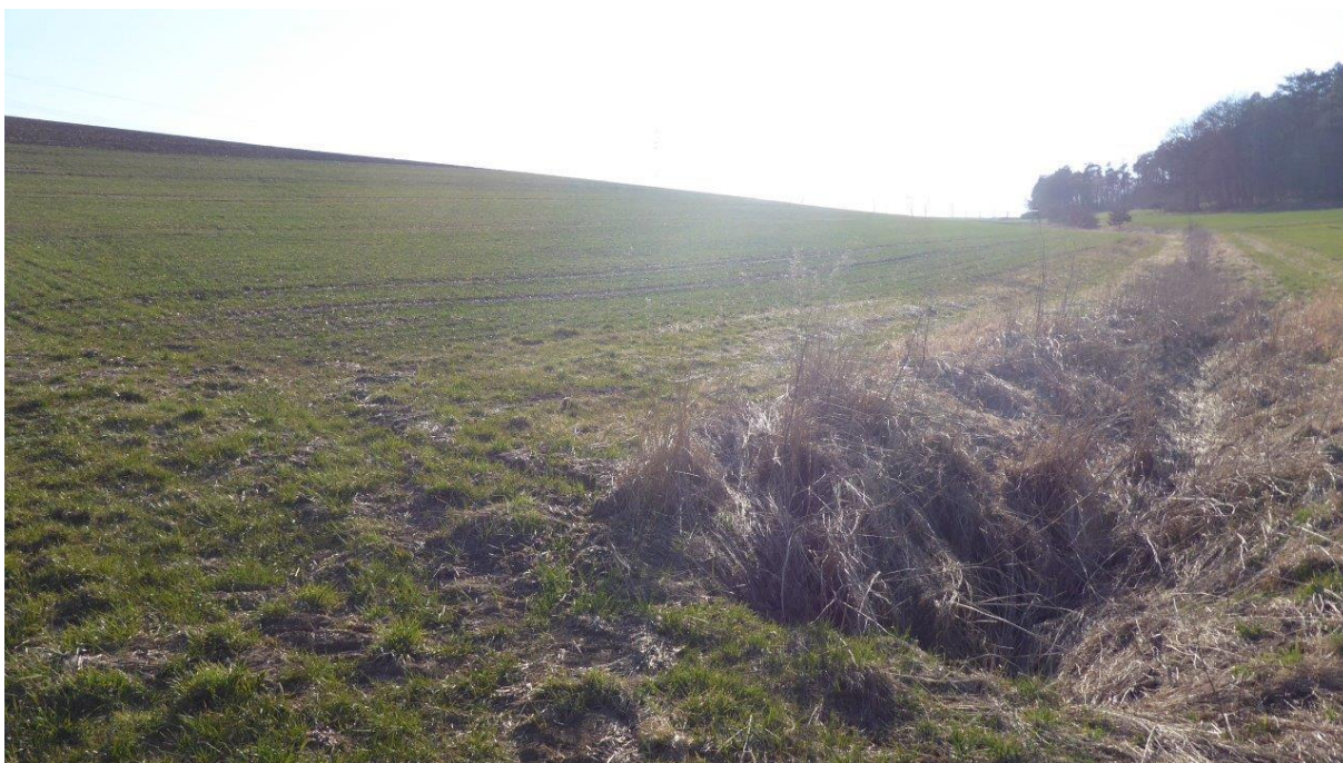
Abb.5: Östlicher Beginn des offenen Grabens