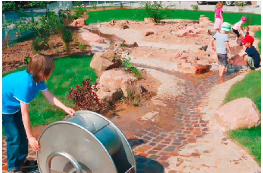
So könnte der Wasserspielplatz im Badgarten aussehen.